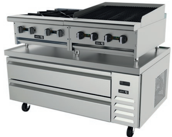
ACBR-52 HC + AEHP-4-24 + AERB-24

IMPORTANTE: los equipos de "Cocción de Sobremesa" a ubicar sobre las Bases de Chef Refrigeradas deberán incluir las patas, las cuales deberán adquirirse con el fabricante. El espacio mínimo requerido entre la base de los equipos de "Cocción de Sobremesa" y la parte superior de las cubiertas de las Bases de Chef Refrigeradas debe ser de al menos 4". El incumplimiento de lo citado elimina la garantía otorgada por parte de ONNERA MEXICO.