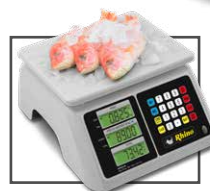
Ideal para pescaderías