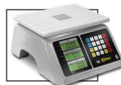
Incluye mica protectora