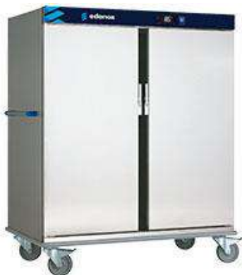
Distribución y exposición de alimentos - Carros - Carros calientes Thermik y mantenimiento de temperatura