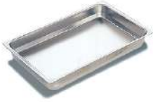
Recipientes GN de acero inoxidable Cubetas lisas sin asas